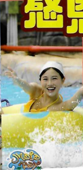
Maha Bay 馬拉灣